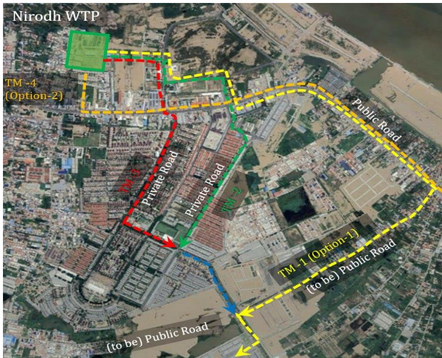
រូបភាព ១៖ បង្ហាញពីការកែសម្រួលផ្លូវសម្រាប់អូសបណ្តាញទឹកស្អាត (Routes) (ក្នុងសង្កាត់សង្កាត់និរោធ និងសង្កាត់វាលស្បូវ)

គម្រោងពង្រីកប្រព័ន្ធប្រព្រឹត្តិកម្មទឹកស្អាតនិរោធ (ដំណាក់កាលទី៣) បានធ្វើបច្ចុប្បន្នភាព និងកែសម្រួលផ្លូវសម្រាប់អូសបណ្តាញទឹកស្អាត (Routes) ដើម្បីបញ្ចប់ការសិក្សាលើគម្រោងនេះ។ ការកែសម្រួលផ្លូវសម្រាប់អូសបណ្តាញទឹកស្អាត (Routes) គឺផ្ដោតជាសំខាន់ក្នុងខណ្ឌខណ្ឌច្បារអំពៅ ដែលមានសង្កាត់ពីរគឺសង្កាត់និរោធ និងសង្កាត់វាលស្បូវ ដូចមានបង្ហាញក្នុងផែនទីខាងក្រោម៖